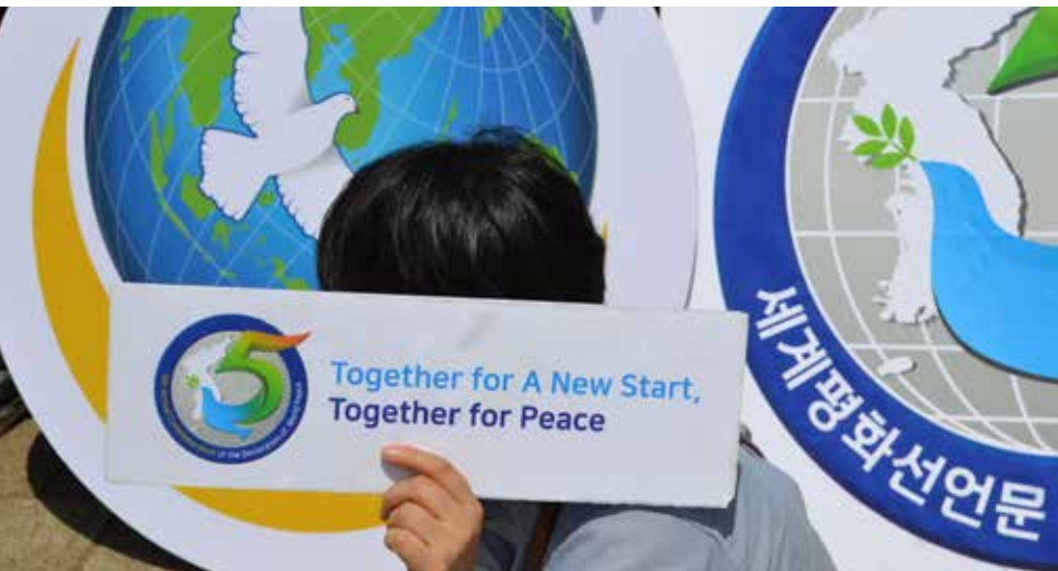
Typische Shincheonji Symbole