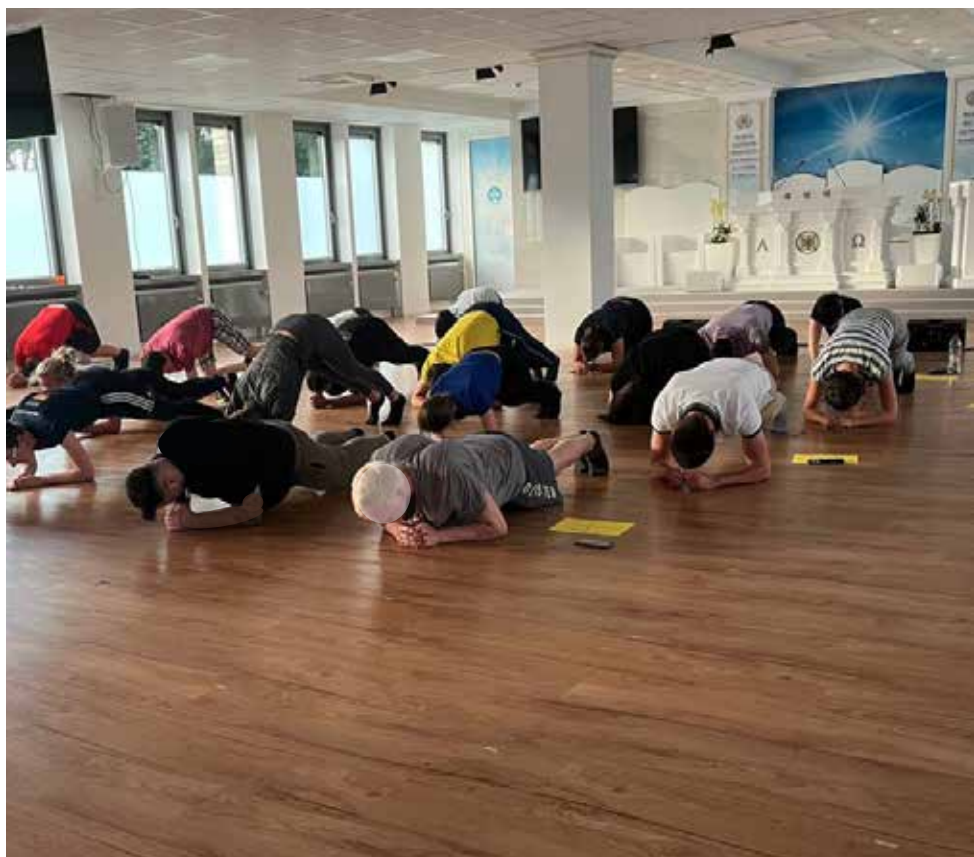
Blick in den „Tempel“ von Shincheonji Frankfurt. Körperliche Übungen während des „Boot-Camps“.

Im Jahr 2022 wurde bekannt, dass Shincheonji regelmäßig sogenannte „Boot-Camps“ veranstaltet, in denen Mitglieder, die nicht genug missioniert oder sich engagiert haben, über mehrere Tage und Nächste regelrecht »gedrillt« werden. Etwa werden bei dieser aus dem Militär oder dem Strafvollzug bekannten Methode Schlafentzug, Mind-Lectures und körperlicher Drill angewendet.